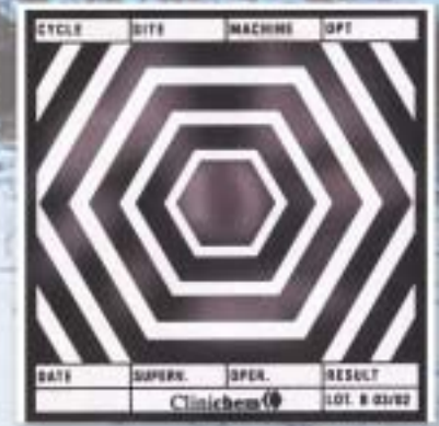
Märkä höyry tai tiivistymättömiä kaasuja (läiskää/kuvioita/rengasmainen kuvio keskellä) - Paine tai lämpötila tai molemmat liian alhaiset. - Kuivaus toimii puutteellisesti. - Höyryn seassa hiilidioksidia.