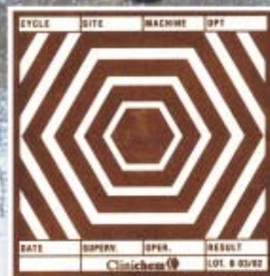
Ylisterilointi (tasainen ruskea) - Lämpötila liian korkea suhteessa paineeseen tai testi-aika liian pitkä tai molemmat.