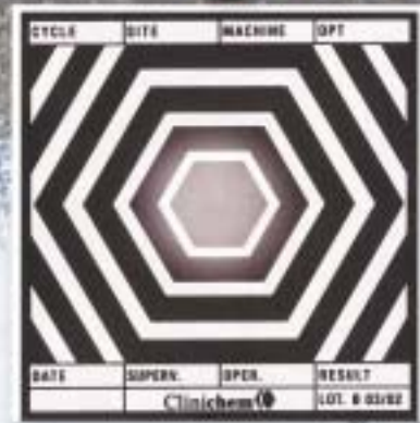
Ilmatasku (vaalea läiskä keskellä tai keskustan tuntumassa) - Oven tiiviste tai anturin tai tuuletin läpivienti tai putkiliitokset vuotaa. - Alipaineistus ei toimi. - Laite huollettava.